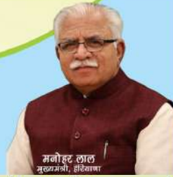
मनोहर लाल मुख्यमंत्री, हरियाणा